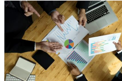
Markt / Vertrieb